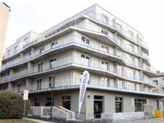
Viel private und gemeinsame Freifläche

Gemeindebau NEU Nummer 13 am Montecuccoliplatz verfügt über 62 moderne und leistbare Wohnungen und versorgt auch die Nachbarschaft mit neuer Infrastruktur.