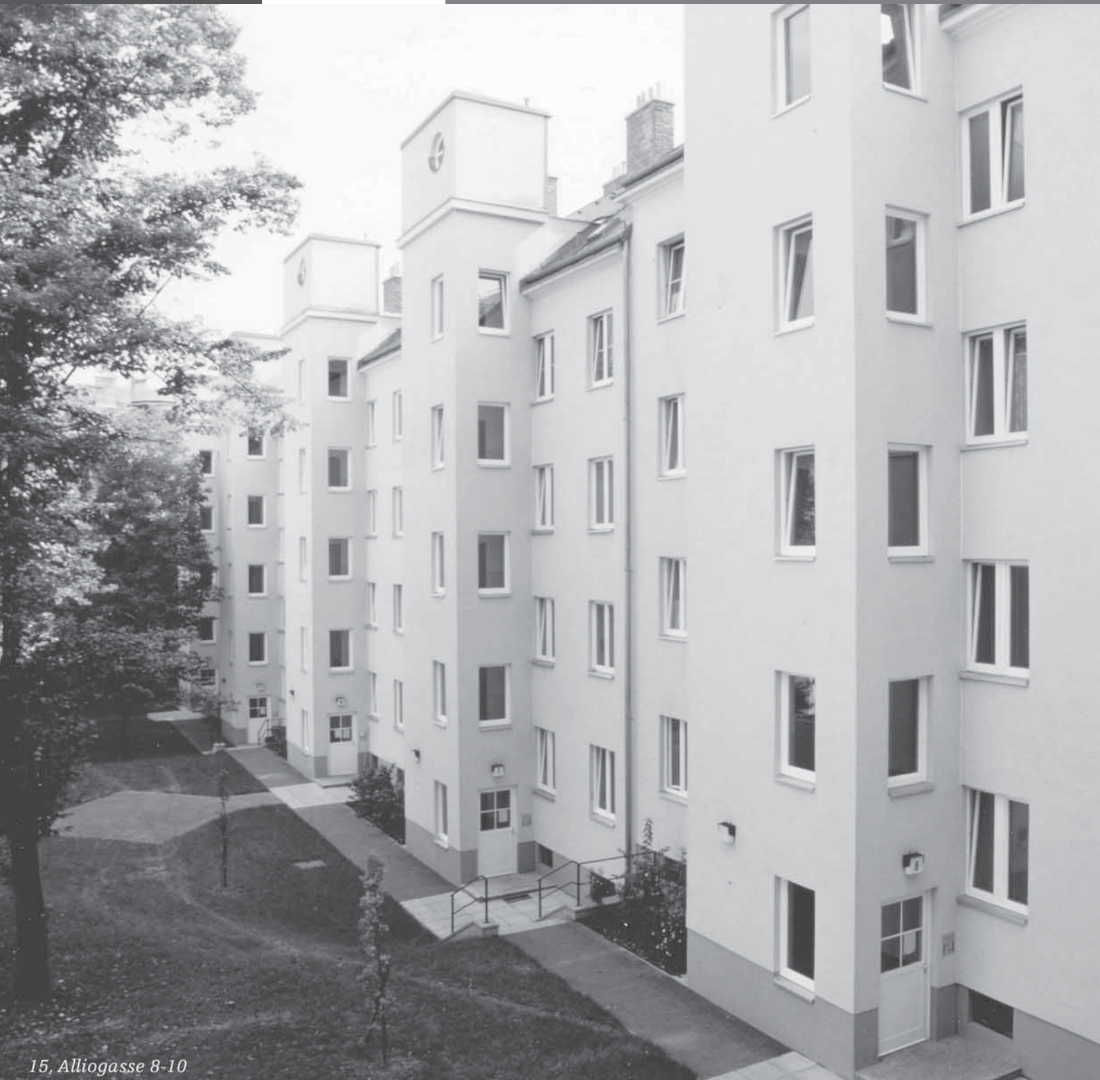
15, Alliogasse 8-10