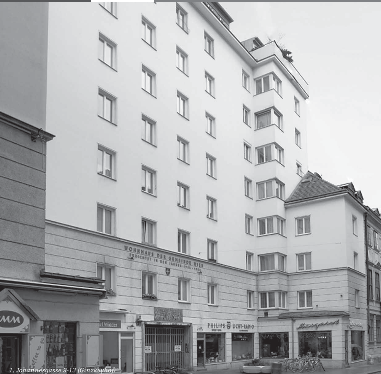
1, Johannesgasse 9-13 (Ginzkeyhof)