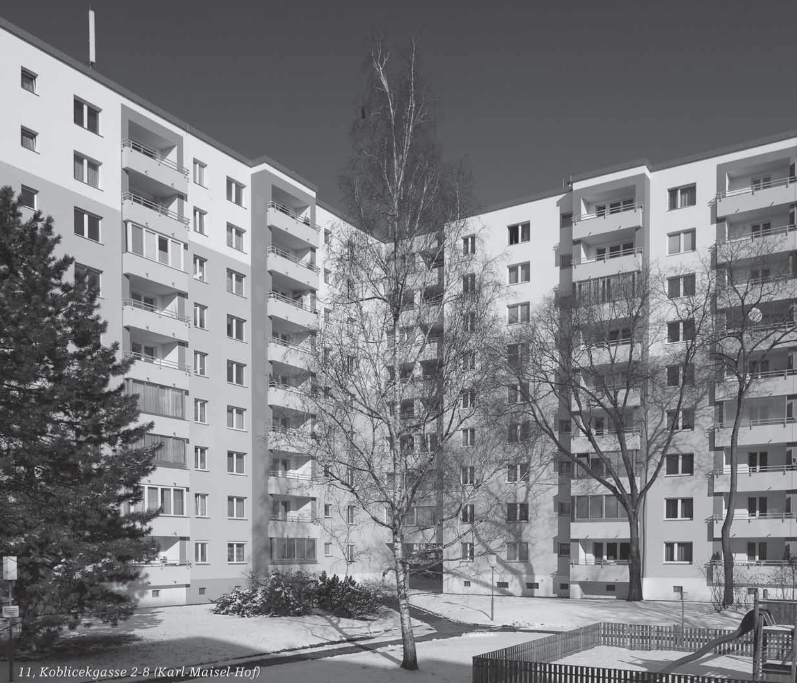
11, Koblitzgasse 2-8 (Karl-Maisel-Hof)