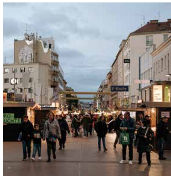
Die Geschäftsmeile und ihr Weihnachtsmarkt