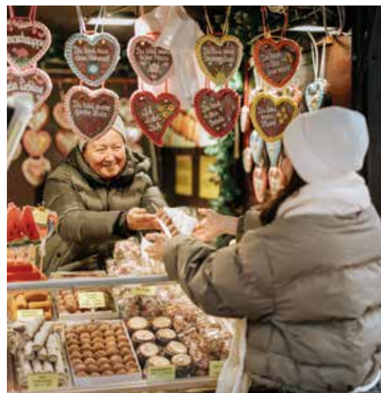
Kalorien in der schönsten Form zum Herzerwärmen