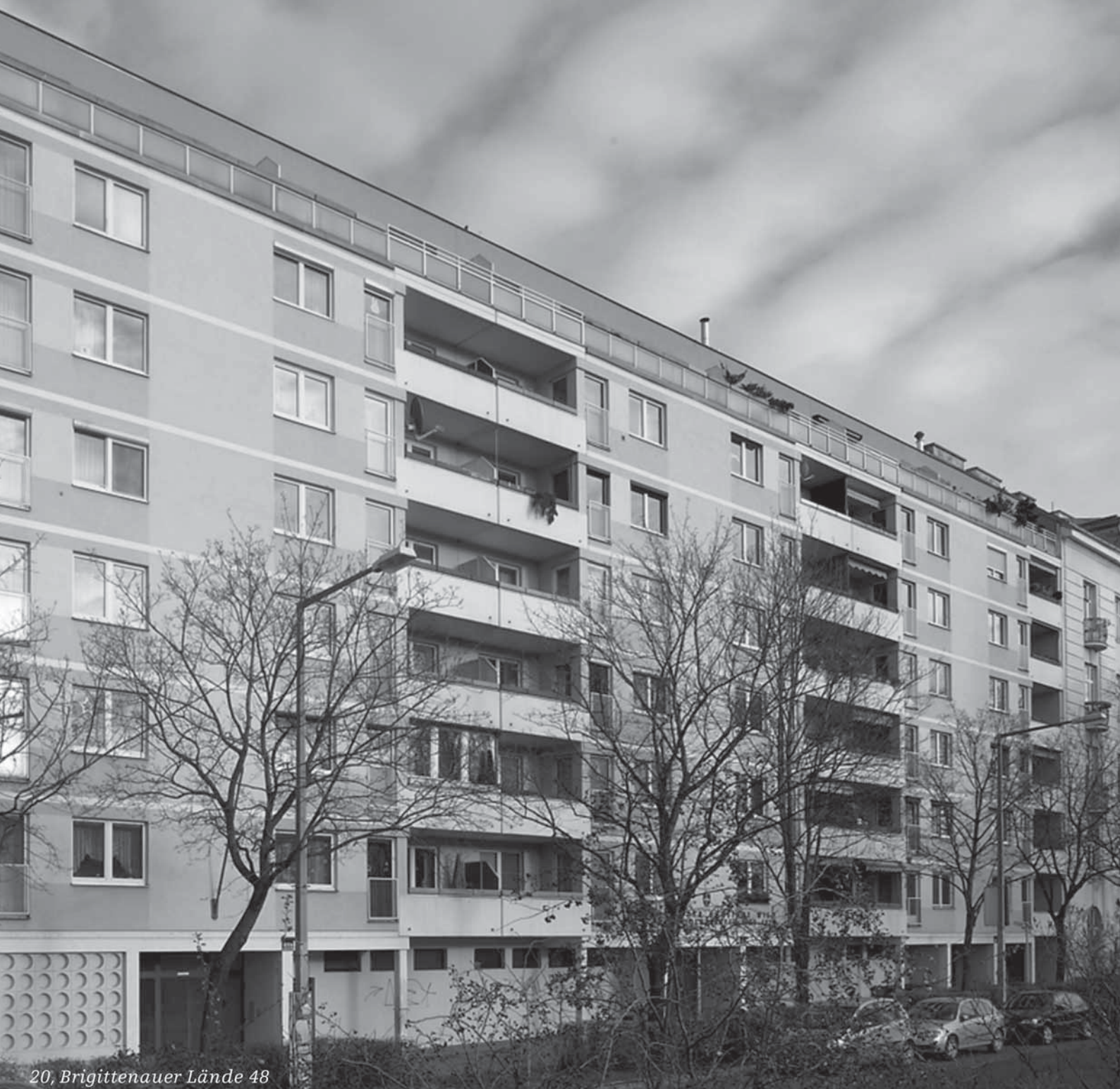
20, Brigittenauer Lände 48