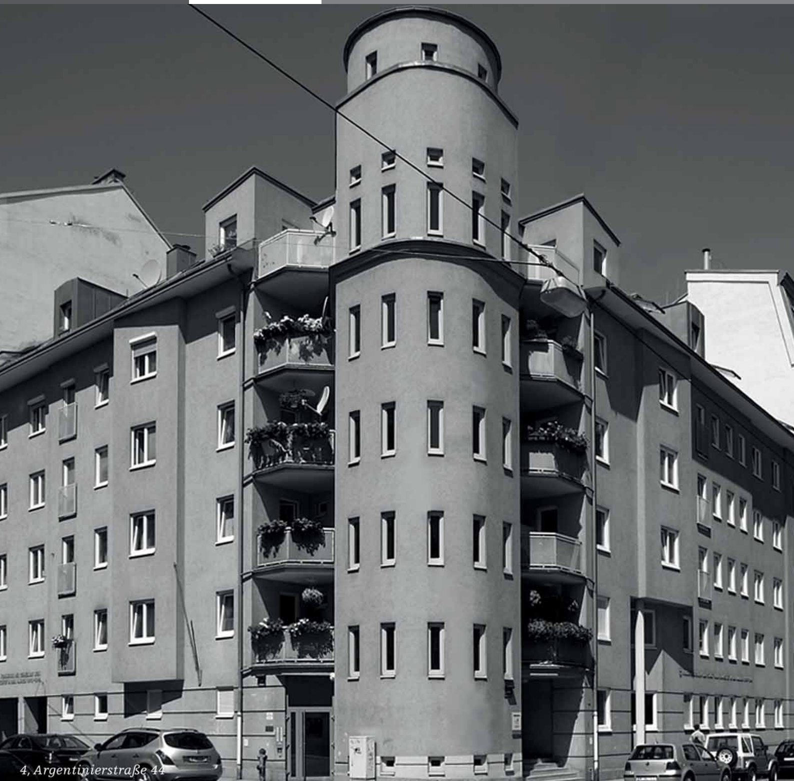
4, Argentinierstraße 44

Die Wohnungsinserate-Zeitschrift von WIENER WOHNEN