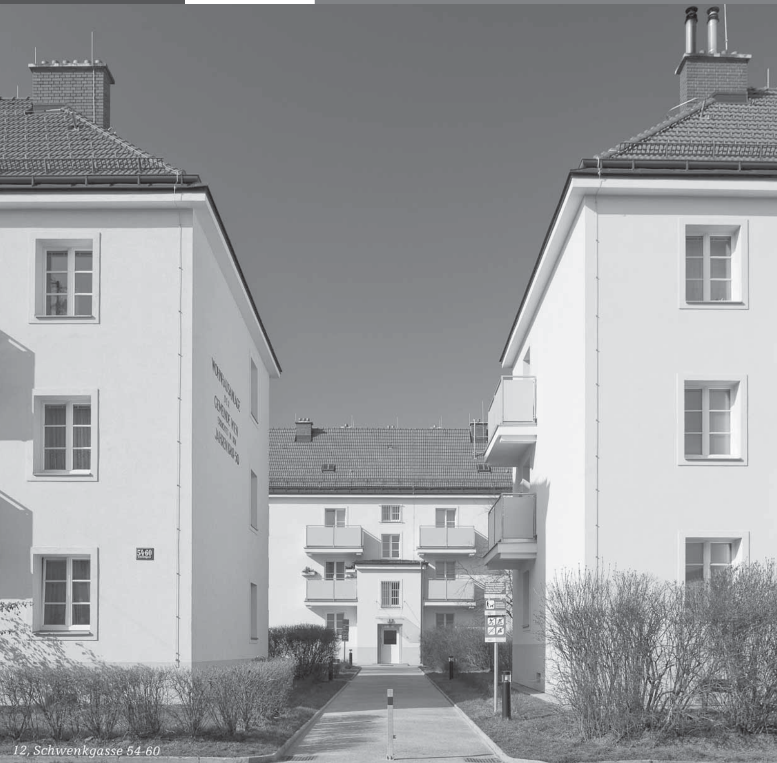
12, Schwenkgasse 54-60