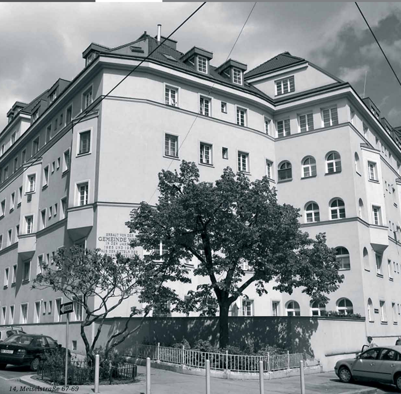
14, Meiselstraße 67-69