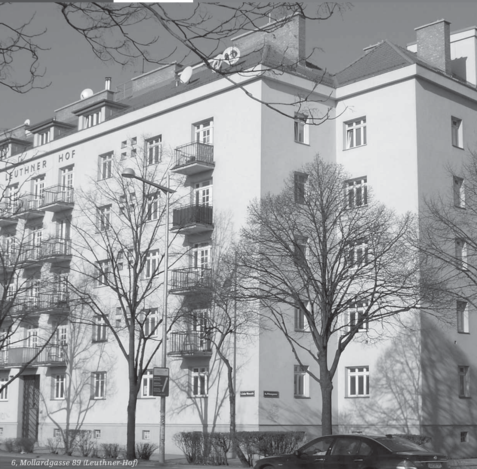
6, Mollardgasse 89 (Leuthner-Hof)