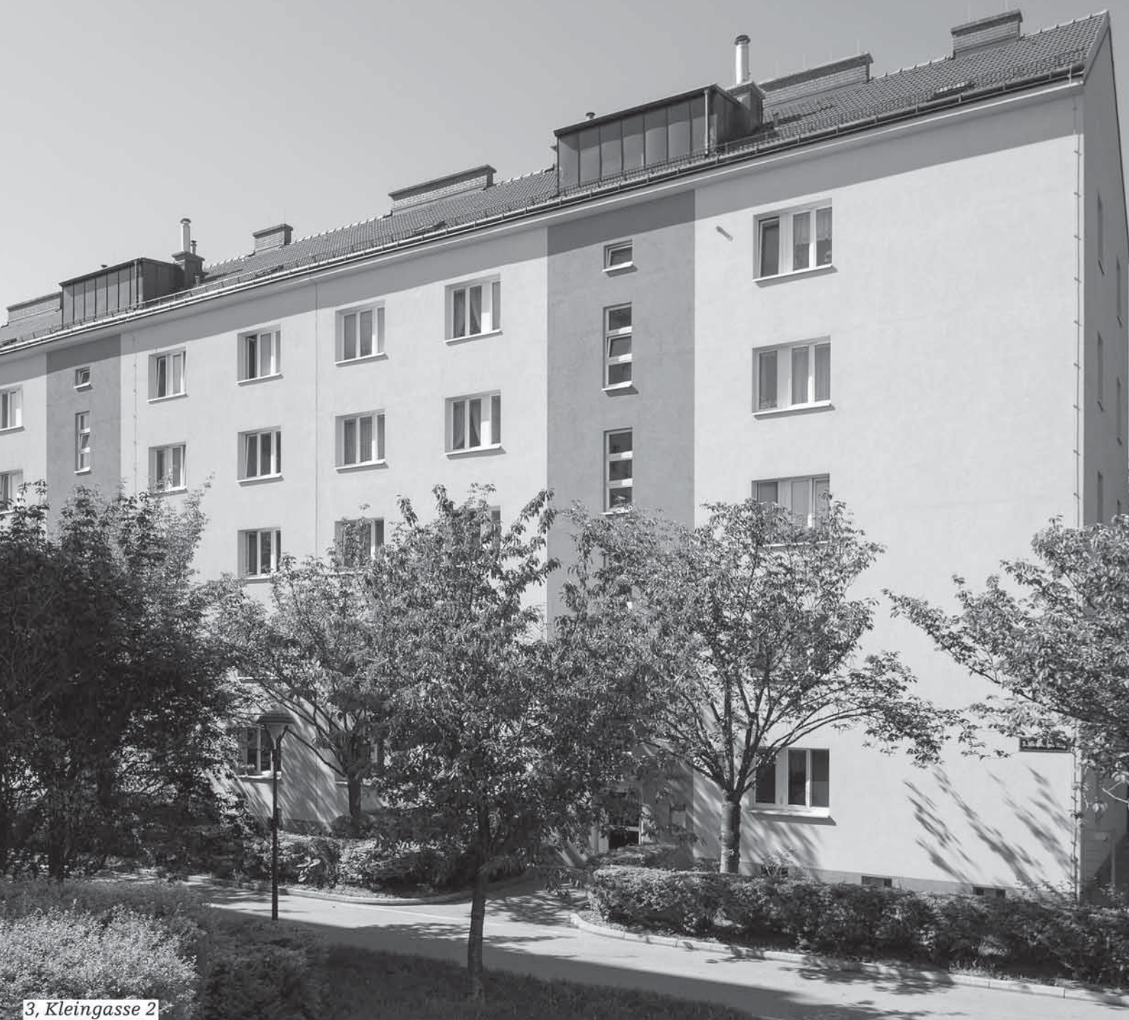
3, Kleingasse 2