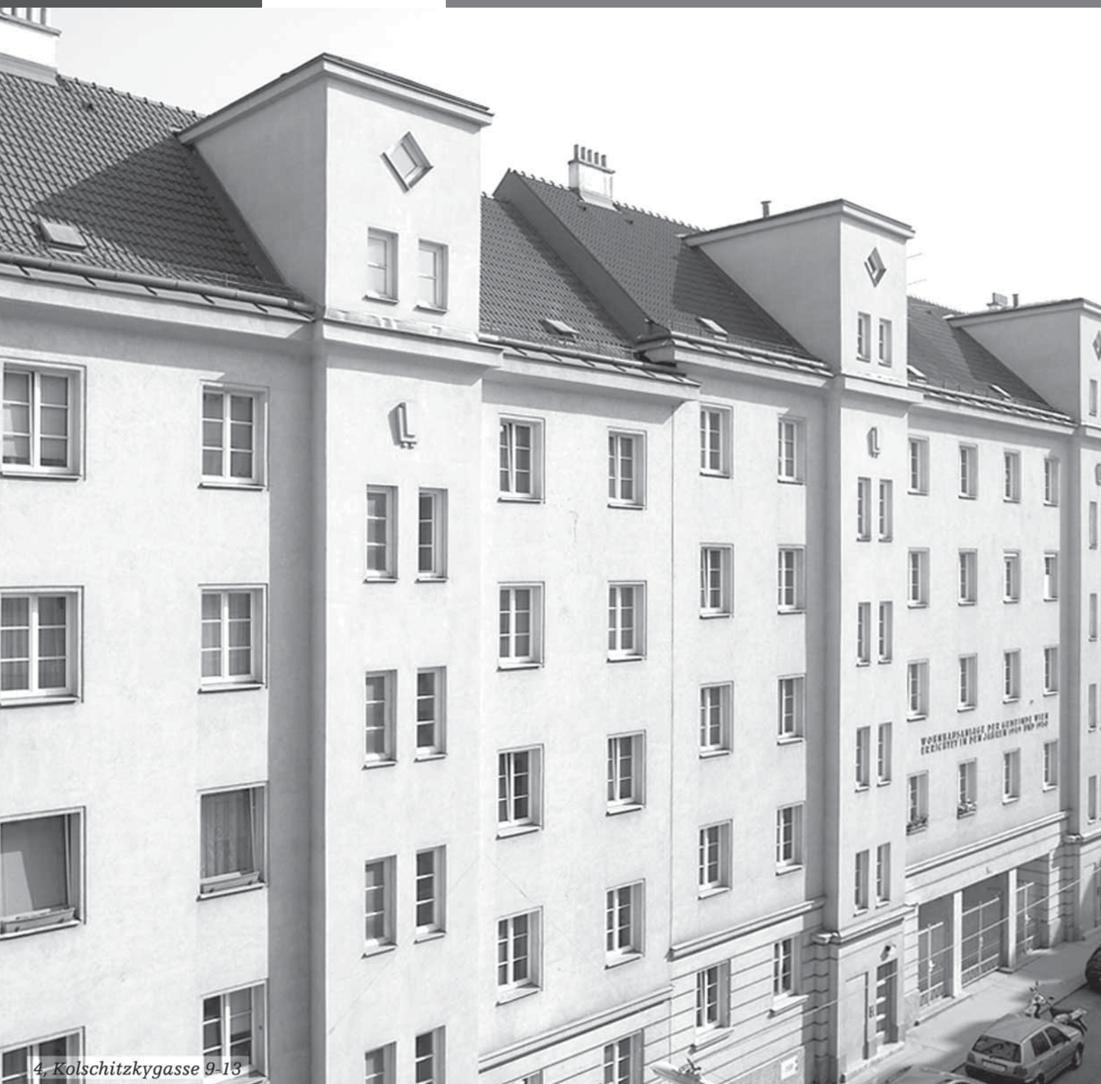
4, Kolschitzkygasse 9-13